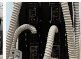
Zapojení rukojetí do konektoru na zadní straně