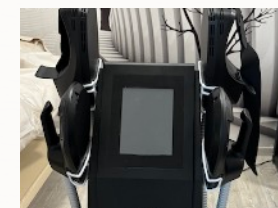
Zapojení přístroje symetricky

Důležité při prvotním zapojení přístroje dbát manuálu. Zapojení přístroje je důležité pro správnou funkčnost. Dvě stejné rukojeti zapojujete vždy vedle sebe, nikoliv pod sebe. Uchycení rukojetí na přístroji je poté dle vlastního uvážení. Rukojeti jsou na přístrojové desce následně označeny jako A a B. Tím následně ovládáte jeden typ rukojetí a nebo druhý typ v závislosti na ošetřované partii.