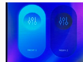
Po zapnutí přístroje výběr režimu

Přístroj je velmi snadné ovládat. Po spuštění stroje pouze zvolíte režim číslo 1. a nastavíte hodnotu síly, kterou zákazník požaduje. V režimu číslo 1. se vše nastavuje automaticky a vy jako obsluha volíte pouze sílu stroje. Během procedury můžete snižovat a nebo zvyšovat sílu stroje a jeho radiofrekvenci. Režim číslo 2. je manuální a nedoporučuje se. V režimu číslo 2. nastavujete frekvenci jednotlivých kontrakcí, přicházíte tak o automatickou proměnu frekvencí, jako je u režimu číslo 1.